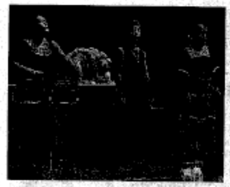
Traditionalist Councy pur the Landers botten Persent Sudoesta (yet Indiathers Summirsum), Hidle Size Led Dut. Huiselinen (yet India).