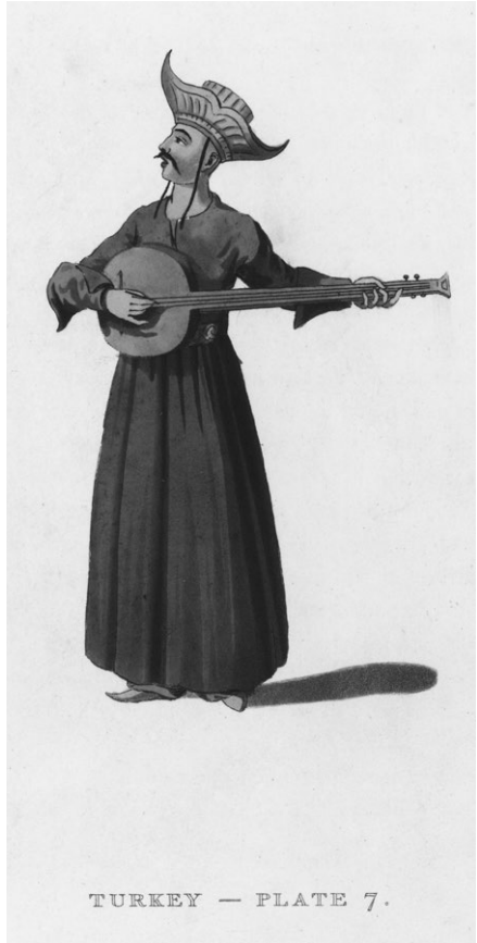
EIN TURK-MUSIKER SPIELT AUF DER LANGHALSLAUTE SAZ. Zeichnung von 1814.