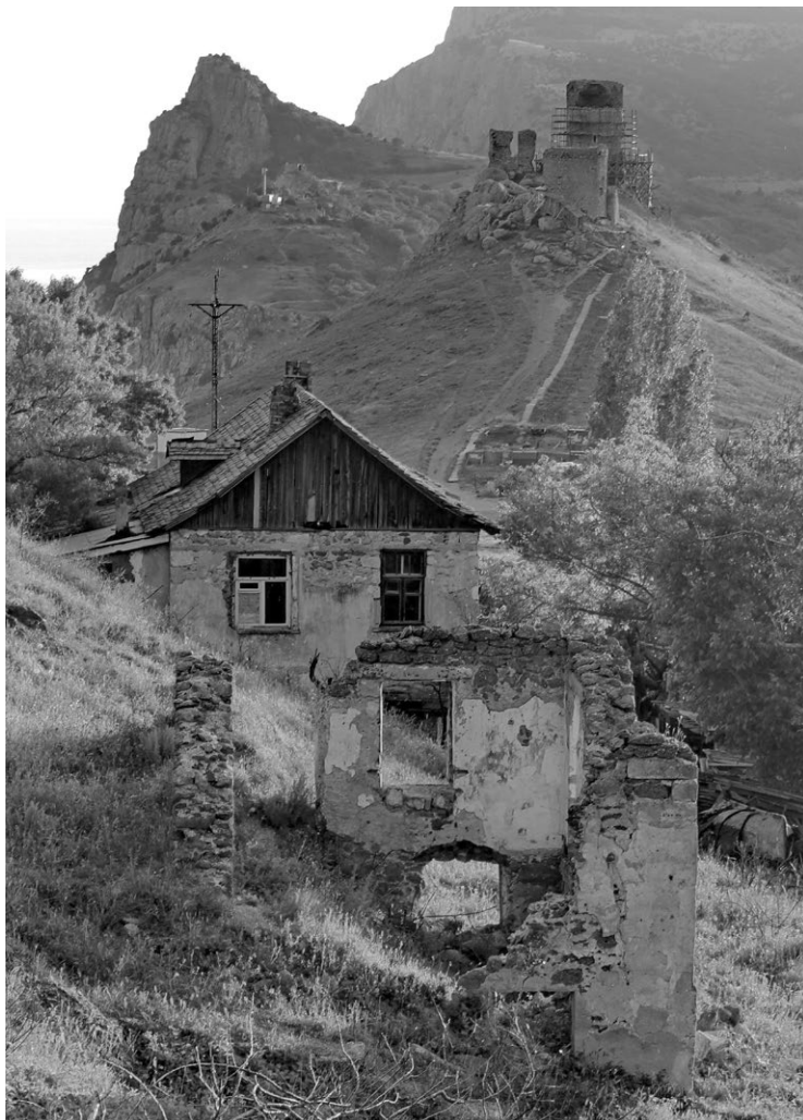
RUINE EINER GENUESISCHEN FESTUNG aus dem 14. Jahrhundert mit verlassenen Häusern auf der Krim.