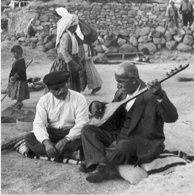
AŞIK VEYSEL beim Bağlama-Spielen.

Âşık Veysel Şatıroğlu, meist nur Âşık Veysel (1894–1973) genannt, war einer der berühmtesten und prägendsten Volkssänger, Bağlama-Spieler und Dichter des anatolischen Raums im 20. Jahrhundert. Er wurde in eine alevitische Familie geboren. Im Alter von sieben Jahren verlor er sein linkes Auge während einer Pockenepidemie. Das rechte Auge verlor er später durch einen Unfall, den sein Vater verursachte. Um seinen Sohn zu trösten, kaufte sein Vater dem Zehnjährigen eine Langhalslaute Bağlama. Später wurde Âşık Veysel