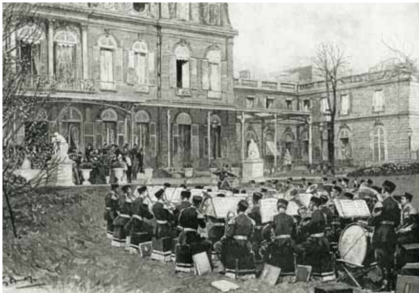
Blaskonzert im Garten des Elysée-Palasts in Paris, 1897

Quellen aus römischer Zeit zeugen von kriegerischen und zivilen Bläserformationen. Nach dem Untergang des Weströmischen Reichs im Jahr 476 verlor die Blasmusik unter dem Einfluss der Kirche ihre Bedeutung, bis sie im 13. Jahrhundert wieder zum wichtigen Bestandteil des öffent-