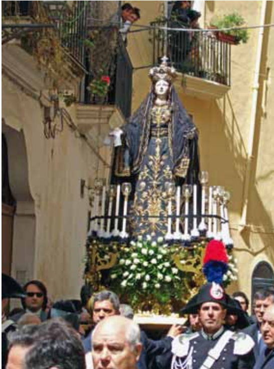
Die trauernde Maria