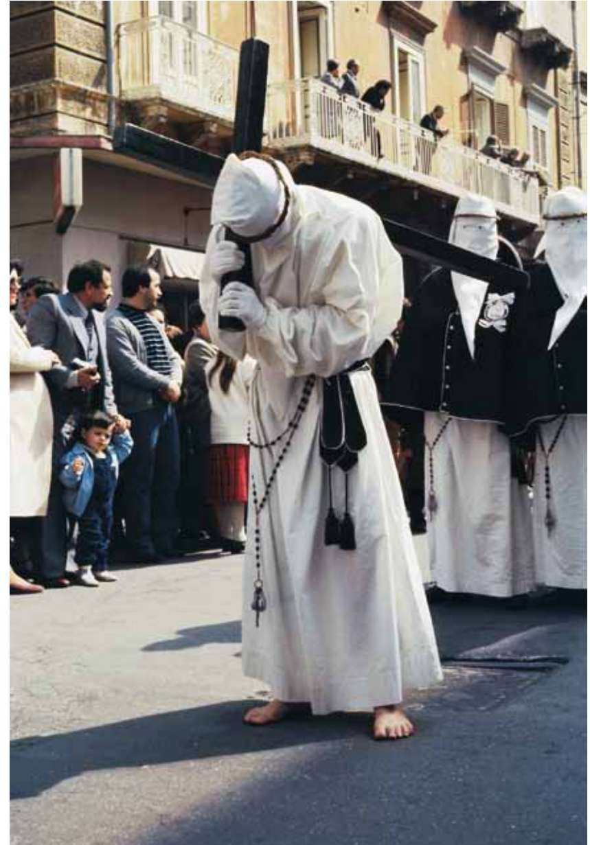
Prozessionsteilnehmer in Taranto

— Beeindruckend sind die Klagegesänge der Frauen bei der Karstags-Prozession in Canosa di Puglia und in Molfetta: Hunderte schwarz verhüllter Frauen mit einem dunklen Schleier vor dem Gesicht singen, begleitet von der Banda , den Inno alla desolata , die Hymne an die untröstliche Maria. Das Erscheinungsbild der Frauen, aber auch ihr Gesang, der Wechsel zwischen laut und leise, die Steigerung zu hellen, fast gellenden Tönen, erinnert an die Lamenti der Klageweiber, deren Tradition auf archaische Rituale aus Griechenland und Kleinasien zurückgeht. Diese Klageweiber, die gegen Bezahlung die Toten betraueren, wurden von der Kirche verboten. Doch auch hier verschmolzen heidnische und christliche Traditionen. Die Figur der trauernden Maria, die in kaum einer Prozession fehlt, trägt meistens kostbare schwarze Kleider und einen Schleier vor dem Gesicht. Es gibt aber auch Darstellungen der im Wahn der Verzweiflung weinenden Maria mit aufgelösten Haaren, die an die Bilder der Klageweiber erinnern.