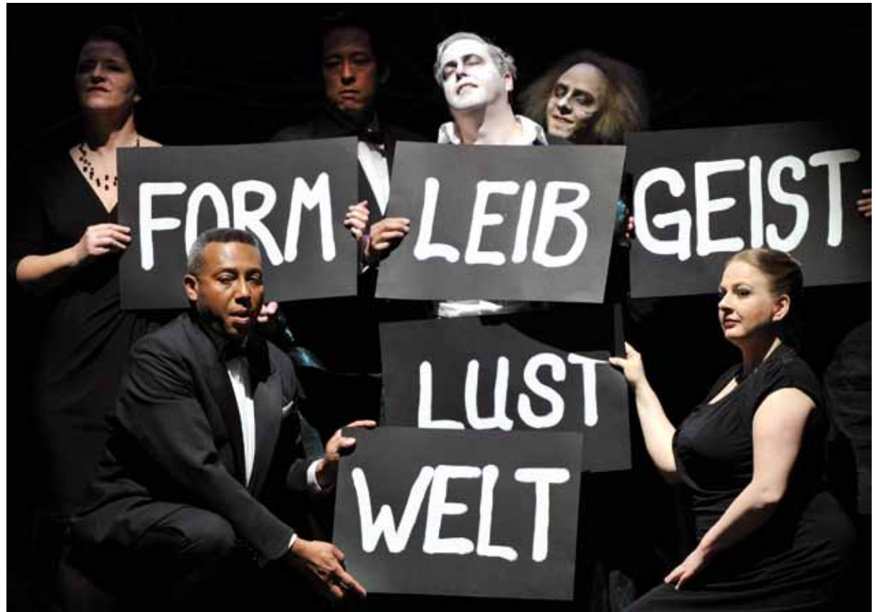
„Die Versuchung des heiligen Antonius“, das Abschlussprojekt des Stipendiatenjahrgangs 2009–2011, wurde am 8. Mai 2012 unter großem Beifall am Oldenburgischen Staatstheater uraufgeführt.

Bei den Osterfestspielen der Berliner Philharmoniker, die 2013 ihre Premiere in Baden-Baden feiern werden, sind auch die Stipendiaten und Alumni der Akademie Musiktheater heute vertreten. Gemeinsam mit dem Orchester und anderen Künstlern erarbeiten die Akademisten die „Zauberflöte für Kinder“ sowie die Kammeroper „Cendrillon“.