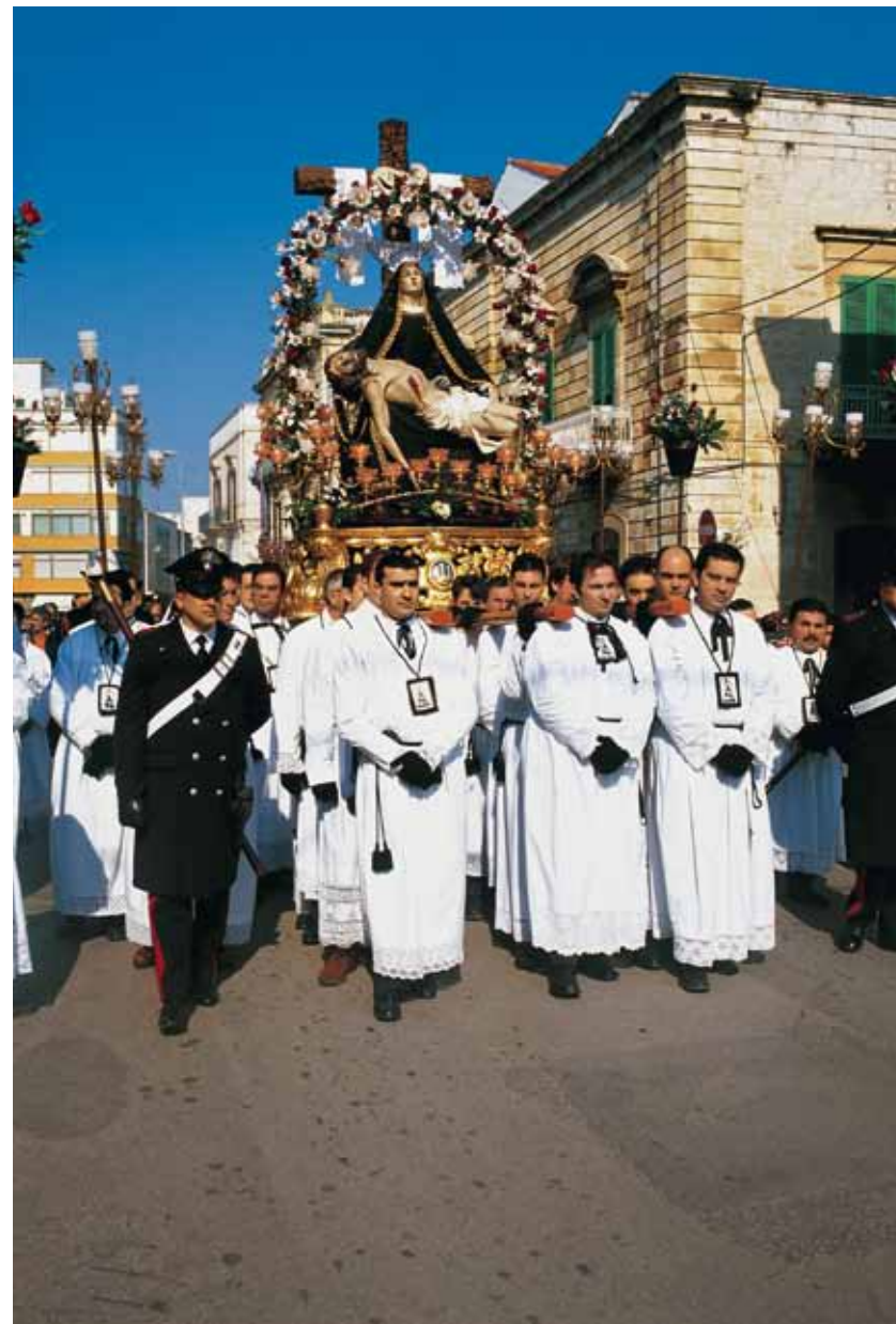
Karfreitagsprozession in Ruvo di Puglia

— Es mag weit hergeholt erscheinen, die Posaunen von Jericho als Urform des Blasorchesters herbei zu zitieren. Dennoch lassen sich Parallelen entdecken, die bis heute für die Banda charakteristisch sind: Die Musiker spielen unter freiem Himmel, meistens in der Fortbewegung; langsam schreitend im religiösen oder im zeremoniellen Kontext, marschierend in militärischem Schritt.