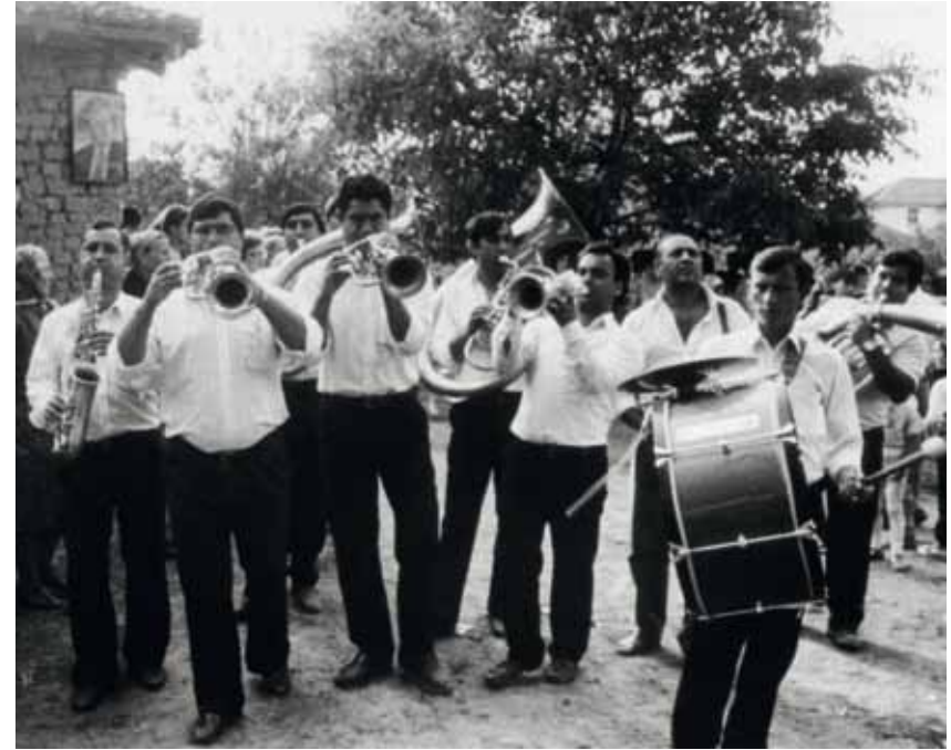
Roma-Blaskapelle in Südserbien

kam besonders in den Werkskapellen der englischen Industriestädte zum Tragen, wo das Musizieren als vernünftige Freizeitbeschäftigung der Arbeiterklasse propagiert wurde. Fabrikbesitzer spendeten Instrumente und Uniformen für die Brass Band. Einwanderer aus Deutschland, Italien und Osteuropa brachten die Blasmusik in die USA, wo sie sich auf eigene Art weiter entwi-