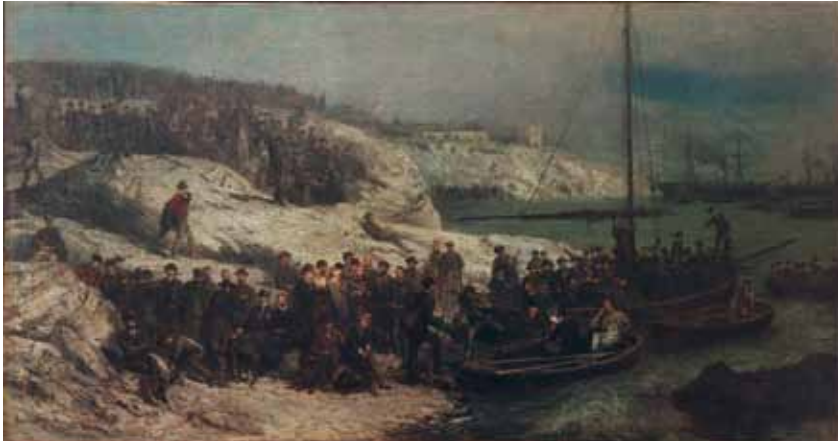
Einschiffung Garibaldis und des »Zugs der Tausend« zur Eroberung Siziliens, Gemälde von Pierre Henry van Elven