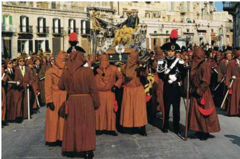
Karfreitag im apulischen Molfetta

IN DER KARWOCHE FINDEN SICH DIE MENSCHEN SÜDITALIENS IN JEDER STADT UND BEINAHE JEDEM DORF ZU LANGEN, THEATRALISCHEN PROZESSIONEN ZUSAMMEN.