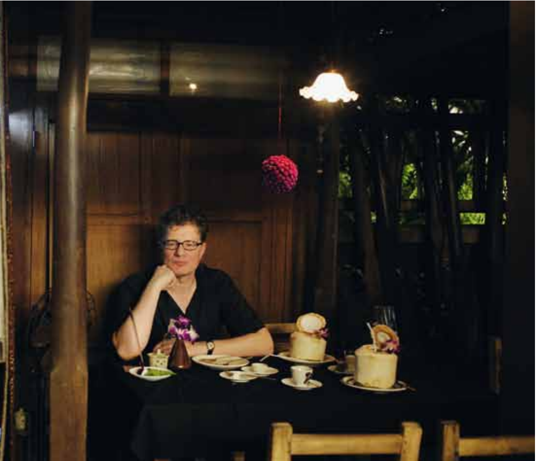
Roger Willemsen unterwegs in Afghanistan

MUSIKALISCH »UNTERWEGS« ZU SEIN, VERSPRICHT BEGEGNUNGEN MIT KULTUREN, DIE DIE CHARAKTERISTIKA ECHTER INDIVIDUEN BEWAHREN.