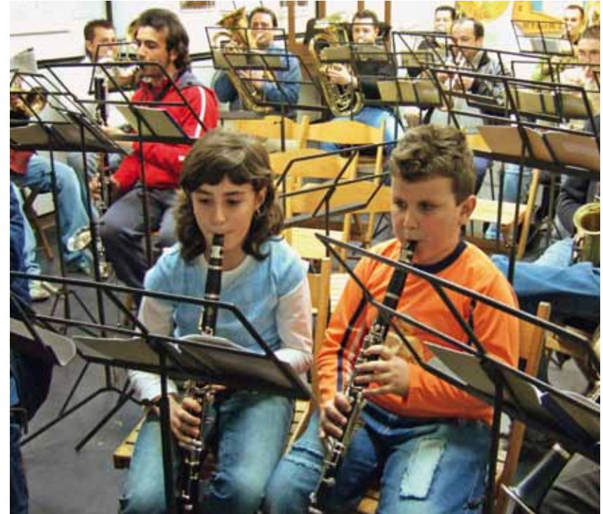
Banda-Probe – schon die Kinder erproben hier ihr Talent

— Die Banda leistete einen wichtigen Beitrag zur Popularisierung von Verdi und anderen Opernkomponisten. In jedem Dorf, in jedem Stadtviertel entstand eine Banda municipale, die sich von der Banda militare darin unterschied, dass sie zur Zivilgesellschaft gehörten und sich überwiegend aus Laienmusikern zusammen-