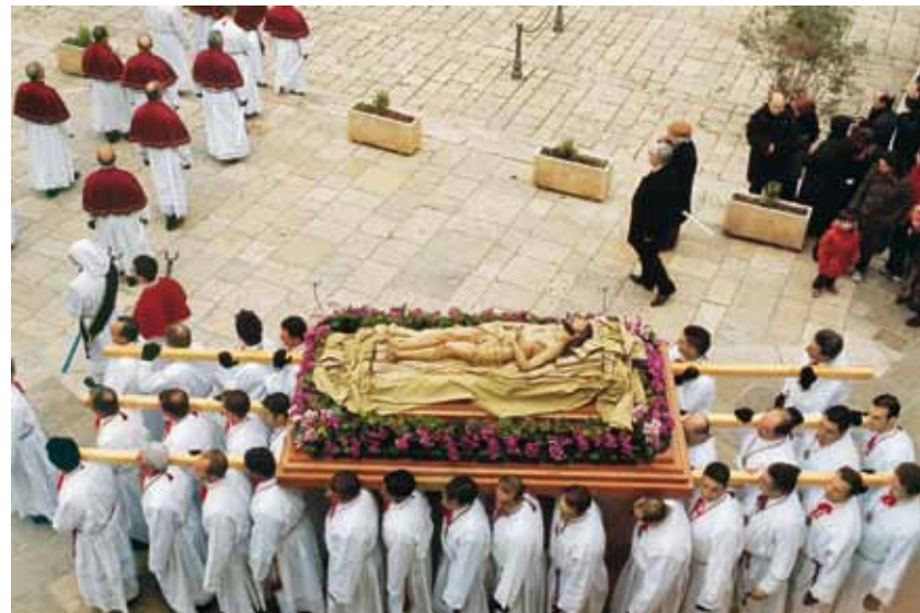
Eine »Confraternite« während der Karfreitagsprozession in Ruvo

— Das Ende des Winters und das Wiedererwachen der Natur wurde schon in vorchristlicher Zeit mit magisch-religiösen Reinigungsritualen gefeiert. Die Vorstellung von Tod und Auferstehung eines Gottes entspricht der Erfahrung von der Regeneration des Lebens im Zyklus der Jahreszeiten. In Süditalien hat die dunkle Seite dieses Verwandlungsprozesses, die auf Leid, Reue und Tod ausgerichtet ist, eine besondere Bedeutung. In der Karwoche finden sich die Menschen in jeder Stadt und beinahe jedem Dorf zu langen, theatralischen Prozessionen zusammen. Am Karfreitag wird mit den Misteri der Leidensweg Jesu nachvollzogen. Die Männer der Confraternite – religiöser Bruderschaften – tragen gigantische Holzskulpturen, die einzelne Stationen der Via Crucis plastisch darstellen: Jesus am Ölberg, die Geißelung, die Kreuzigung, die Grablegung. Bis zu 20 solcher Figurenbilder scheinen über dem